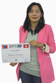
Хөтөлбөрийн оролцогч “Цэцэг Трейд” ХХК-ийн захирал