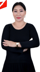
“Classic Photo Studio”