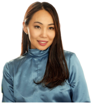
BPN -ийн хөтөлбөрийн оролцогч DEW брэндийн үүсгэн байгуулагч