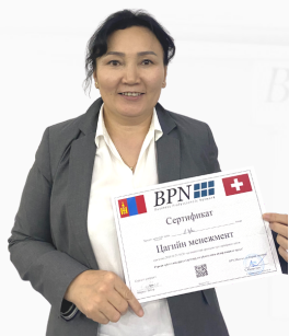
Хөтөлбөрийн оролцогч “Персон” Эмэгтэйчүүдийн эмнэлгийн захирал