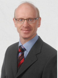
ВРN Монгол салбарын Швейцар захирал Маркус Эппер

ВРN-ийн зүгээс энэ хүнд цаг үед бизнес эрхлэгчдэдээ зориулан шинэлэг, практикт суурилсан онлайн сургалтуудаа тогтмол санал болгож байна.