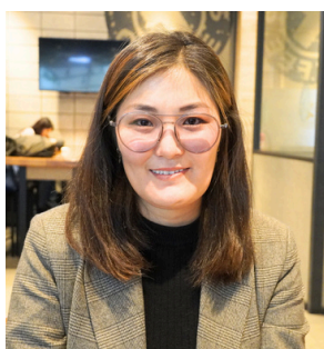
Зэ Цэ Фэйшн ХХК-ийн захирал