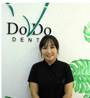
ДОДО дент ХХК-ийн захирал